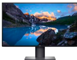
ΟΘΟΝΗ DELL ULTRASHARP 27 4K USB-C | U2720Q

Εκτελέστε απρόσκοπτα πολλαπλές εργασίες σε τρεις συσκευές, χρησιμοποιώντας αυτό το premium σετ πληκτρολογίου πλήρους μεγέθους και λαξευμένου ποντικιού με προγραμματιζόμενα πλήκτρα συντόμευσης και διάρκεια μπαταρίας που φτάνει τους 36 μήνες 14