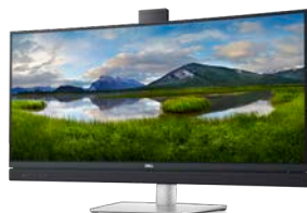
ΚΥΡΤΗ ΟΘΟΝΗ DELL 34 ΓΙΑ ΒΙΝΤΕΟΔΙΑΣΚΕΨΕΙΣ | C3422WE

Εργαστείτε με γρήγορους ρυθμούς, χάρη στον ισχυρό σταθμό σύνδεσης Dell Thunderbolt Dock. Φορτίστε ταχύτερα τον υπολογιστή σας και συνδέστε έως και δύο οθόνες 4K, καθώς και τα περιφερειακά σας, με ένα μόνο καλώδιο.