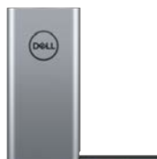
POWER BANK PLUS ΓΙΑ ΦΟΡΗΤΟΥΣ ΥΠΟΛΟΓΙΣΤΕΣ DELL – USB-C, 65 WH | PW7018LC

Επαναφορτιζόμενο ποντίκι με μεγάλη διάρκεια μπαταρίας που φτάνει τους έξι μήνες σε πλήρη φόρτιση 12