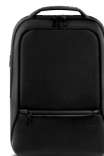
ΣΑΚΙΔΙΟ DELL PREMIER SLIM 15 | PE1520PS

Με γρήγορη παροχή υψηλής ισχύος έως και 65 Wh, αυτό το power bank μπορεί να φορτίσει τη μεγαλύτερη γκάμα φορητών υπολογιστών USB-C και κινητών συσκευών.