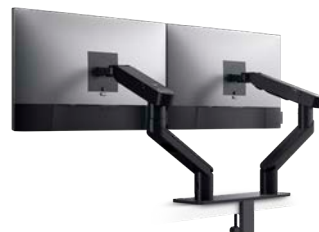
ΒΡΑΧΙΟΝΑΣ ΔΥΟ ΟΘΟΝΩΝ DELL | MDA20

Μεταμορφώστε την εμπειρία εικονικών συσκέψεων με μια κυρτή οθόνη 34" που έχει δυνατότητες συνεργασίας παγκόσμιας κλάσης.