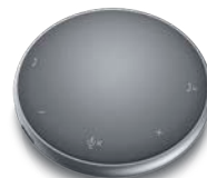
ΦΟΡΗΤΟΣ ΠΡΟΣΑΡΜΟΓΕΑΣ DELL ΜΕ ΗΧΕΙΟ ΑΝΟΙΧΤΗΣ ΑΚΡΟΑΣΗΣ | MH3021P

Απολαύστε εντυπωσιακές λεπτομέρειες και ρεαλιστική αναπαραγωγή χρωμάτων σε αυτήν την εκπληκτική οθόνη 4K 27" με ευρεία χρωματική κάλυψη.